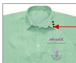
ปกเสื้อพละนักเรียนชาย ม.ต้น

- เสื้อพละ ใช้เสื้อโปโลคอเชิ้ตสีเขียว ปักตราของโรงเรียนที่กระเป๋าสีเสื้อตามแบบของโรงเรียนด้วยด้ายหรือไหมสีชมพู เหนือกระเป๋าสีเสื้อ ๑ \frac{๑}{๒} เซนติเมตร ปักเลขประจำตัวนักเรียนตามขนาด และแบบของโรงเรียน ด้วยไหมสีชมพูเข้ม ที่บริเวณปกเสื้อด้านซ้ายตอนบนให้ปักเครื่องหมายบอกคณะสีและระดับ ชั้นเรียน โดยนักเรียนมัธยมศึกษาตอนต้นปักเช่นเดียวกับเสื้อนักเรียนสีขาว นักเรียนมัธยมศึกษาตอนปลายให้ปักเป็นขีดทึบใช้ไหมปักตามสีของคณะที่สังกัด ขนาดความกว้าง ๐.๒ เซนติเมตร ความยาว ๑ เซนติเมตร ม. ๔ ปัก ๑ ขีด ม. ๕ ปัก ๒ ขีด และ ม. ๖ ปัก ๓ ขีด