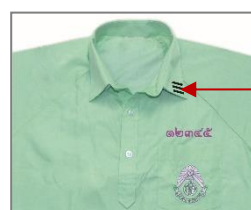
ปกเสื้อพละนักเรียนชาย ม.ปลาย