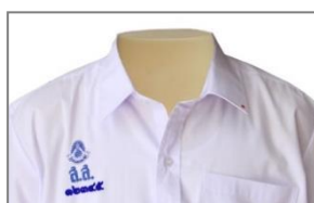
การปัก ส.ส. และเลขประจำตัว ม.ปลาย