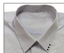
การปักวงกลม ปกเสื้อนักเรียน

๓.๑.๓ เข็มขัด เป็นเข็มขัดหนังสีน้ำตาลพื้นเรียบ ขนาดกว้าง ๓ - ๔ เซนติเมตร ยาวตามส่วนขนาดตัวของนักเรียน หัวเข็มขัดเป็นโลหะสีทองรูปสี่เหลี่ยมผืนผ้า ชนิดกลัดที่มีกลัดอันเดียว ๑ ปลอก ขนาดกว้าง ๑.๕ เซนติเมตร สำหรับสอดปลายเข็มขัด เข็มขัดสอดไปในหูกางเกง การสวมห้ามหันกลับเอาด้านในออก ห้ามขีดเขียน หรือทำเครื่องหมายใด ๆ บนเข็มขัด