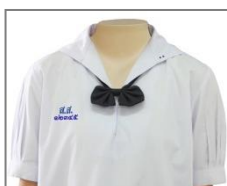
การปัก ส.ส. และเลขประจำตัว

๓.๒.๑.๑ เสื้อี ผ้าขาวเกลี้ยง ไม่มีบางเกินสมควร ไม่มีลวดลาย ห้ามใช้ผ้าแพร หรือผ้าที่บางและไม่สามารถรักษารูปทรงเอาไว้ ตัวเสื้อเป็นแบบคอพับในตัวลึกลงสวมศีรษะเข้าได้ สะดวกสวมตลบเข้าข้างใน มีปกขนาด ๑๐ เซนติเมตร ใช้ผ้าเย็บแบบเข้าถ้ำ (คอปกทหารเรือ) แขนสั้น เพียงข้อศอก ปลายแขนจีบเล็กน้อยพับขอบประกอบด้วยผ้าสองชั้นกว้าง ๓ เซนติเมตร ชายเสื้อด้านล่างพับขอบเข้าในกว้าง ๓ เซนติเมตร ขนาดตัวเสื้อกว้างพอเหมาะกับลำตัวไม่รัดเอว ที่ริมขอบด้านล่างขวา ติดกระเป๋านอกกว้าง ๕ – ๙ เซนติเมตร ลึก ๗ – ๑๐ เซนติเมตร ปีกอักษรย่อ ส.ส. และเลขประจำตัวด้วยไหมสีน้ำเงินตามขนาดและแบบของโรงเรียน ที่หน้าอกเสื้อเบื้องขวา ชายเสื้อไว้นอกกระโปรงยาวลงมาไม่เกินนิ้วหัวแม่มือ (เมื่อยืนปล่อยแขนตรง) บริเวณขอบปกเสื้อด้านซ้ายให้ปักด้วยไหมตามสีของคณะที่สังกัดในแต่ละปีการศึกษา เป็นวงกลมที่ขนาดเส้นผ่านศูนย์กลาง ๐.๕ เซนติเมตร เพื่อบอกชั้นเรียน ม. ๑ ปัก ๑ วง , ม. ๒ ปัก ๒ วง , ม. ๓ ปัก ๓ วง