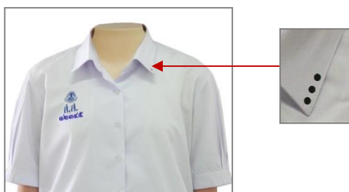
เสื้อนักเรียนหญิง ม.ปลาย

๓.๒.๒.๑ เสื้อ ผ้าขาวเกลี้ยง ไม่มีลวดลาย ไม่บางเกินสมควร ห้ามใช้ผ้าแพรหรือผ้าที่ไม่สามารถรักษารูปทรงเอาไว้ ตัวเสื้อเป็นแบบคอเชิ้ตผ้าคอตลอดที่อกเสื้อทำเป็นซาบตลบเข้าข้างในยาวตลอดกว้าง ๓ เซนติเมตร มีกระดุมกลมสีขาว ๕ เม็ด แขนยาวเพียงเหนือศอกปลายแขนพับจีบพับขอบด้วยผ้า ๒ ชั้น เข้าข้างใน กว้าง ๓ เซนติเมตร หน้าอกด้านขวาประมาณกระดุมเม็ดที่ ๒ ปักอักษรย่อ ส.ส. และเลขประจำตัวได้อักษร ส.ส. ด้วยไหมสีน้ำเงินตามขนาดและแบบโรงเรียน เนื้ออักษรย่อ ส.ส. ปักเครื่องหมายโรงเรียนด้วยไหมสีเดียวกัน ชายเสื้อสอดไว้ในกระโปรงให้เรียบร้อยสามารถมองเห็นเข็มขัดได้ตลอดทั้งเส้น บริเวณขอบปกเสื้อด้านซ้ายให้ปักด้วยไหมตามสีของคณะที่สังกัดในแต่ละปีการศึกษา เป็นวงกลมทึบขนาดเส้นผ่านศูนย์กลาง ๐.๕ เซนติเมตร เพื่อบอกชั้นเรียน ม. ๔ ปัก ๑ วง ม. ๕ ปัก ๒ วง ม. ๖ ปัก ๓ วง