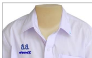
การปัก ส.ส. และเลขประจำตัว ม.ต้น

๓.๑.๒ เสื้อ เป็นเสื้อเชิ้ตคอตั้ง ผ้าขาวเกลี้ยงไม่มีลวดลาย ไม่บางเกินสมควร ห้ามใช้ผ้าแพร หรือผ้าที่ไม่สามารถรักษารูปทรงเอาไว้ได้ ผ่าอกตลอดมีสาบหน้าพับด้านนอก กว้าง ๔ เซนติเมตร กระดุมสีขาวกลม ขนาดเส้นผ่านศูนย์กลางไม่เกิน ๑ เซนติเมตร แขนสั้นเพียงข้อศอก มีกระเป๋าดตรงระดับราวมเบี่ยงซ้าย ๑ กระเป๋า ขนาดกว้าง ๘ - ๑๒ เซนติเมตร ลึก ๑๐ - ๑๕ เซนติเมตร พอเหมาะกับขนาดของเสื้อ ปักอักษร ส.ส. และเลขประจำตัวด้วยไหมสีน้ำเงินตามขนาดและแบบของโรงเรียน ที่หน้าอกเสื้อเบื้องขวาระดับกระเป๋าดซึ่งอยู่ด้านซ้าย สำหรับนักเรียนชั้นมัธยมศึกษาตอนปลาย (ม.๔, ๕ และ ๖) จะต้องปักเครื่องหมายโรงเรียนเหนืออักษร ส.ส. ด้วยไหมสีน้ำเงิน บริเวณขอบปกเสื้อด้านซ้ายตอนปลายให้ปักด้วยไหมตามสีของคณะที่สังกัดในแต่ละปีการศึกษาเป็นวงกลมทึบ ขนาดเส้นผ่านศูนย์กลาง ๐.๕ เซนติเมตร เพื่อบอกชั้นเรียน ชั้น ม. ๑, ม. ๔ ปัก ๑ วง ม. ๒, ม. ๕ ปัก ๒ วง ม. ๓, ม. ๖ ปัก ๓ วง เรียงเป็นแนวตามขอบปกเสื้อและสอดชายเสื้อไว้ในกางเกงให้เรียบร้อยจนสามารถมองเห็นเข็มขัดได้อย่างชัดเจนตลอดทั้งเส้น